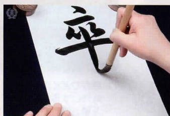
書きぞめ課題の動画